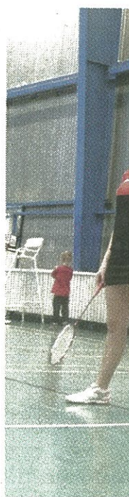
■ Pergalė: R.Alekseičius dvejų varžybų