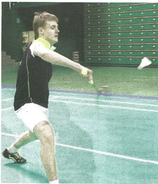
■ Lyderis: I.Reznikai čempionatas buvo sėkmingiausias per visą karjerą.

Klaipėdos badmintonininkai siautė mūsų mieste vykusiame Lietuvos jaunių iki 17 metų čempionate. Visose penkiose grupėse aukso medalius iškovoję uostamiesčio sportininkai.